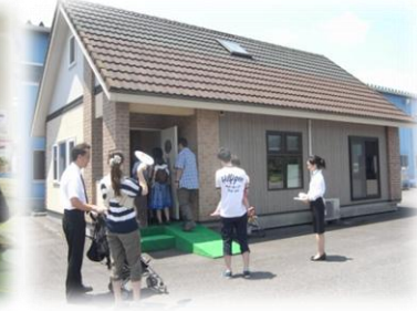
併設モデルハウス