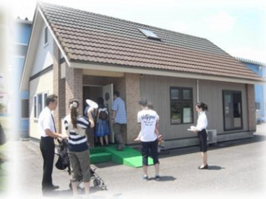
併設モデルハウス