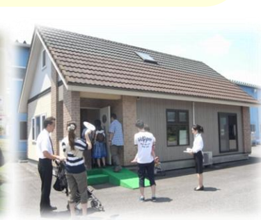
併設モデルハウス