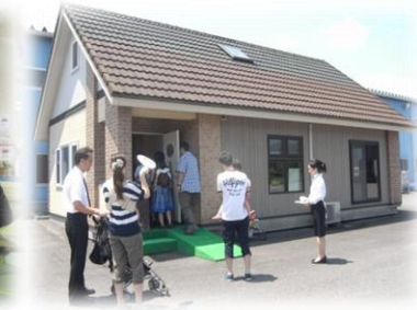
併設モデルハウス