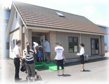
併設モデルハウス