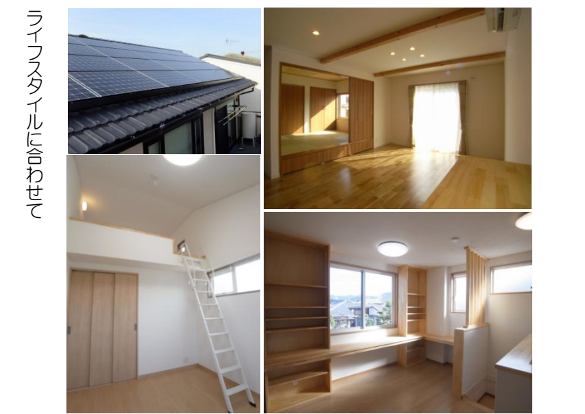
ライフスタイルに合わせて

アクセス 【国道21号線より】 ■ 「各務原町」交差点を南へ—「各務原駅前通り」を南方面へ直進—3つ目の信号を左折—2つ目の角を右折—2本目を右折—突き当たり手前右側