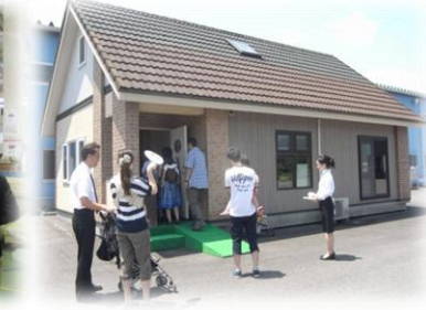
併設モデルハウス