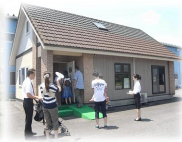
併設モデルハウス