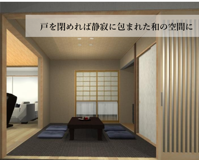
戸を閉めれば静寂に包まれた和の空間に