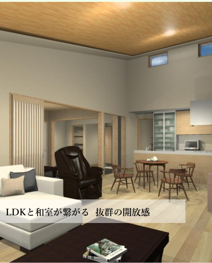
LDKと和室が繋がる 抜群の開放感