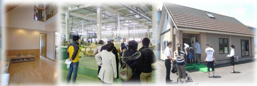
併設モデルハウス