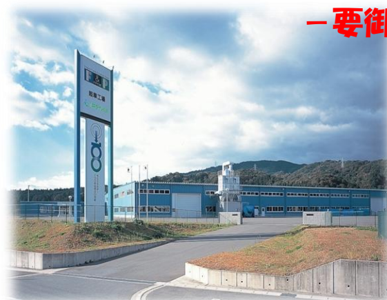
F Pの家 岐阜工場